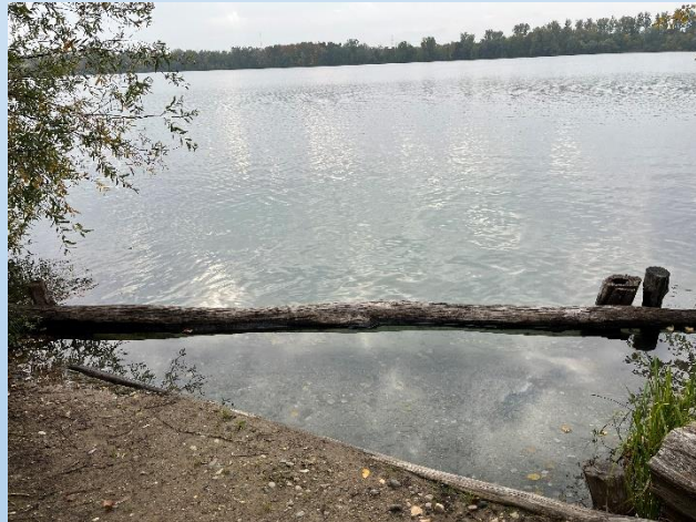
Der See noch unberührt

Flossen an, Luft rein, Sorgen raus – unser Verein hat sich in die Fluten gestürzt. Und wie! Hier kommt der Rückblick auf einen Tag voller Wasser, Witz und Wunder.