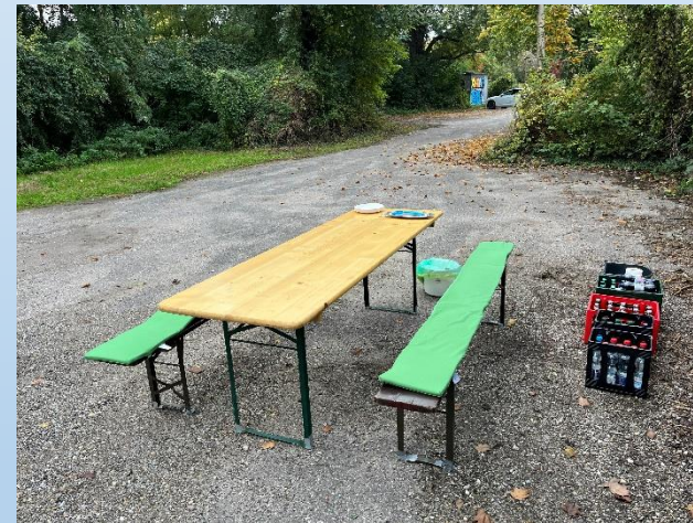
Der Grillplatz, noch unberührt